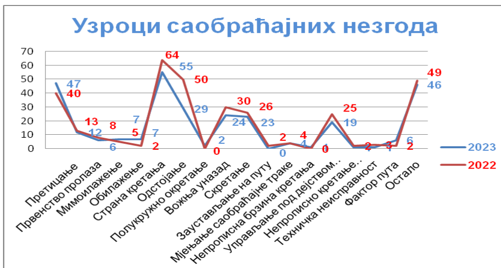
Дијаграм 6. Преглед узрока саобраћајних незгода за 2023. и 2022. годину

Најчешћи узроци настанка саобраћајних незгода у току 2023. године су: