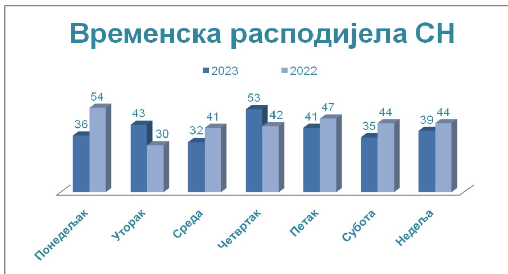
Дијаграм 4. Преглед дневне временске расподеле саобраћајних незгода у периоду од седам дана за 2023. годину

У погледу дневне расподеле СН из ове анализе се види да се у 2023. години, највише СН догодило четвртком 53 СН и уторком 43 СН, а најмање средом када се догодило 32 СН.