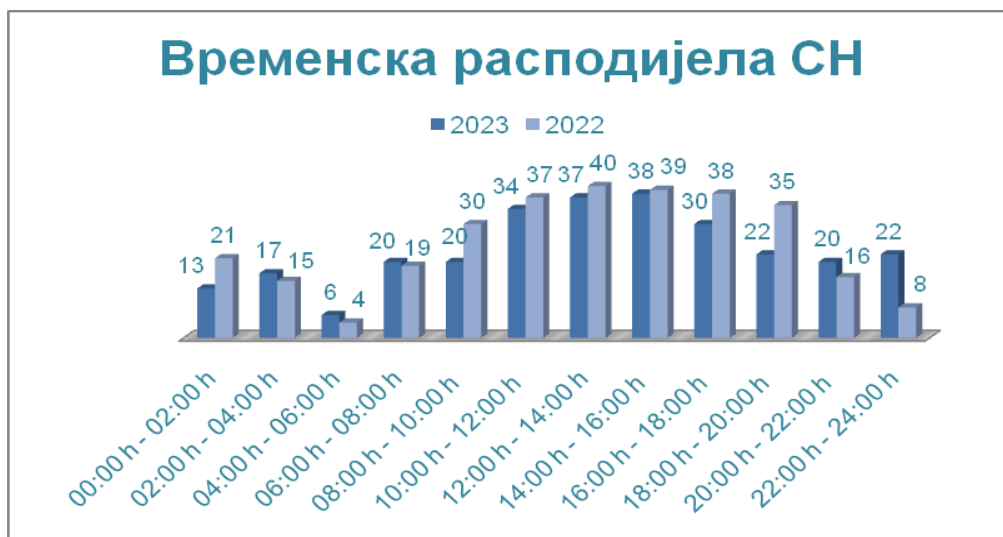
Дијаграм 5. Преглед часовне временске расподијеле саобраћајних незгода у периоду од 24h за 2023. годину

У погледу часовне расподијеле из ове анализе се види да се у 2023. години, највише саобраћајних незгода догодило у времену од 14-16 часова, 38 СН, а најмање СН догодило се у времену од 04-06 часова, 23 СН.