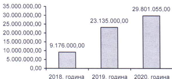
Слика 1. Однос укупно планираних средстава за 2018, 2019. и 2020. годину

Као што је напријед речено, укупна вриједност ових 66 пројеката је 97.842.000 КМ. Планирано је да се за њихову реализацију у периоду од 2020. године до 2022. године издвоји 72.470.000 КМ. При томе је за 2020. годину планирано 29.801.055 КМ што је значајно више него 2019. године, а поготово 2018. године. Разлог томе је почетак и/или наставак реализације великих инфраструктурних пројеката уз помоћ осигураних средстава.