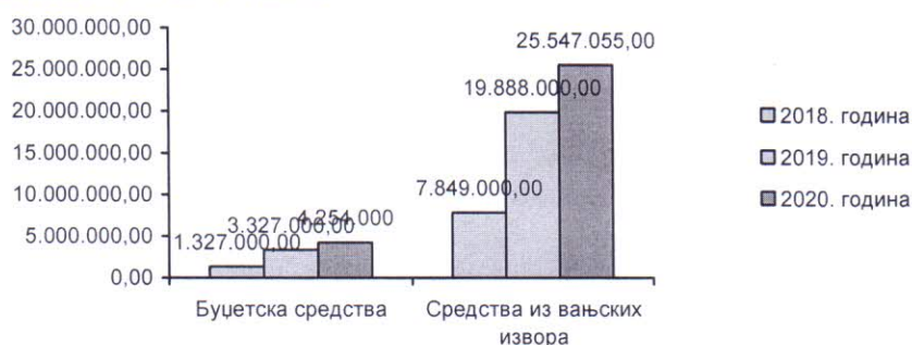
Слика 2. Струкура и однос планираних средстава у 2018, 2019. и 2020. години

Од датих 29.801.055 КМ из буџета је требало обезбједити 4.254.000 КМ (14,27%), а из вањских извора 25.547.055 КМ (85,73%). Ти износи су значајно већи од износа који су планирани из буџета и из вањских извора 2019. и 2018. године.