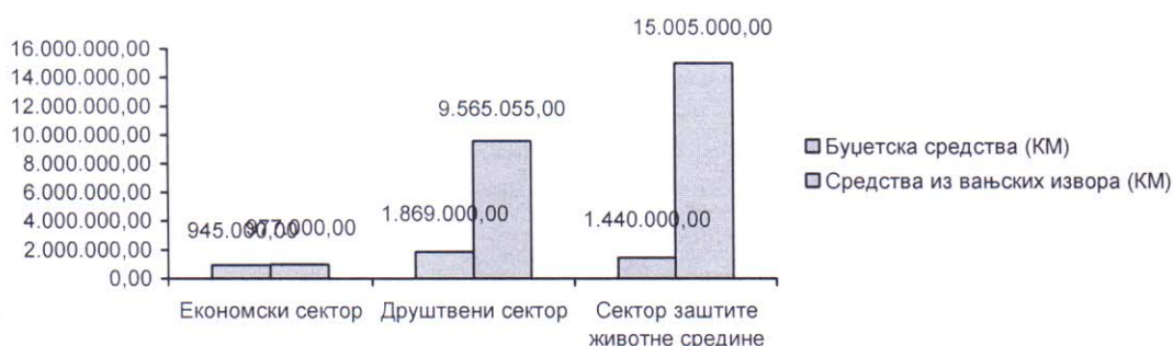
Слика 3. Финансијска структура по секторима за 2020. годину

Секторски гледано, у 2020. години је за пројекте економског сектора планирано 1.922.000,00 КМ или 6,44%, за пројекте из друштвеног сектора 11.434.055,00 КМ или 38,36% и за пројекте из сектора заштите животне средине 16.445,00 КМ или 55,21%.